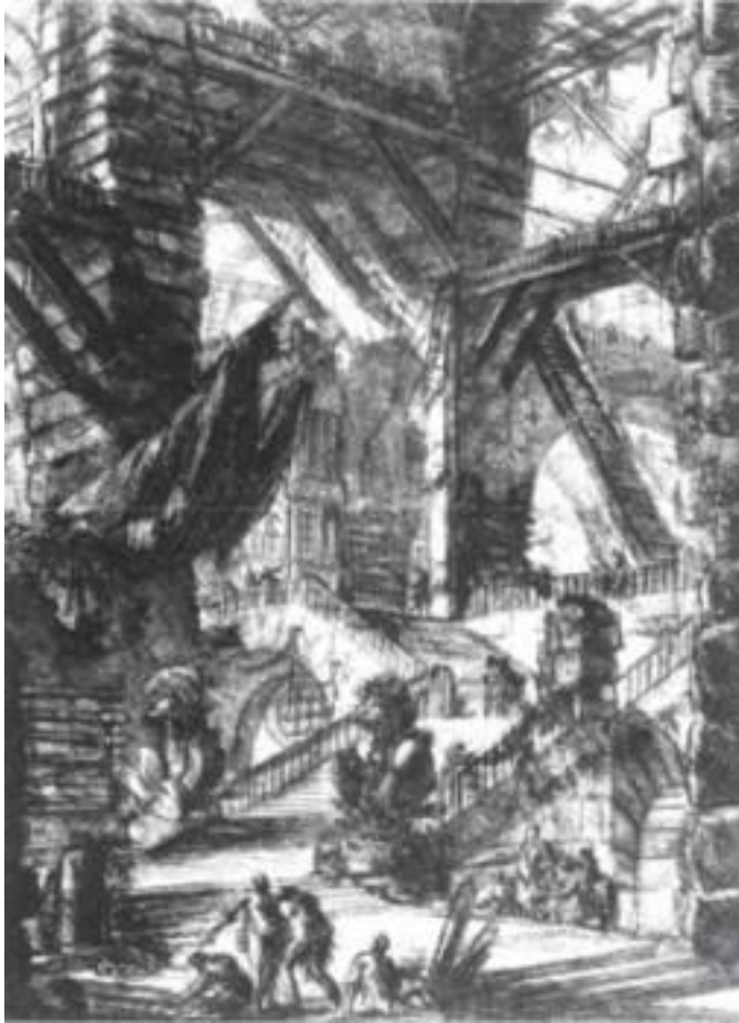
Giovanni Battista Piranesi, Carceri d' Invenzione, 1761. Εμπνευσμένος από έργα σκηνογραφίας, ο Piranesi επηρέασε σημαντικά επόμενες γενιές καλλιτεχνών, επιδέξιων σε ποικίλες προοπτικές απεικονίσεις αρχιτεκτονικών έργων.

Ο Jean d' Alembert, συμμεριζόταν, όπως και οι άλλοι διαφωτιστές, την πίστη στις απεριόριστες ικανότητες του ανθρώπου, τις ρασιοναλιστικές και ατομικιστικές τάσεις, αλλά, σε αντίθεση με αυτούς, υποστήριζε τη διάδοσή τους στο λαό και την παλλαϊκή διαφώτιση. Ο Σκοτσέζος David Hume και ο Γάλλος Jean-Jacques Rousseau (Ρουσό) τοποθετούνται επίσης στο Διαφωτισμό, αν και δεν ήταν σε απόλυτη συμφωνία με το σύνολο των ιδεών του. Ο τελευταίος περιφρονούσε τη λογική, εξυμνούσε τον τρόπο ζωής των πρωτόγονων λαών και υποστήριζε περισσότερο από οποιονδήποτε άλλον την ελευθερία και την ισότητα των πολιτών. Ήταν η πολιτική φιλοσοφία του Rousseau που ενέπνευσε το σύγχρονο ιδεώδες της κυριαρχίας της πλειοψηφίας στους οραματιστές της Γαλλικής Επανάστασης.