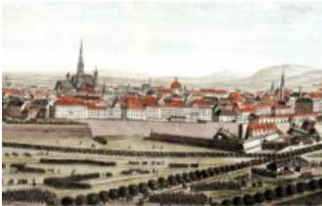
Η Βιέννη στις αρχές του 19ου αιώνα

Το Λονδίνο και το Παρίσι έγιναν αστικά κέντρα με έντονη καλλιτεχνική ζωή. Στη Γερμανία και την Ιταλία, από την άλλη, υπήρχαν μικρότερες πόλεις και εγκαταστάσεις ευγενών και βασιλέων, καθεμία από τις οποίες αποτελούσε ένα ξεχωριστό και ιδιαίτερα σημαντικό κέντρο καλλιτεχνικής δραστηριότητας. Στην Αυστρία, ωστόσο, παρ' όλο που αρκετές πόλεις και Αυλές είχαν αναπτύξει τη δική τους καλλιτεχνική κουλτούρα, η Βιέννη είχε γίνει το κέντρο όπου κατά διαστήματα συγκεντρώνονταν ευγενείς και καλλιτέχνες από όλη την Ευρώπη. Η κοσμοπολίτικη ατμόσφαιρά της ήταν ίσως ένας από τους λόγους για τους οποίους στην πόλη αυτή παρατηρήθηκε το ζύμωμα των διάφορων εθνικών στιλ από την υπόλοιπη Ευρώπη.