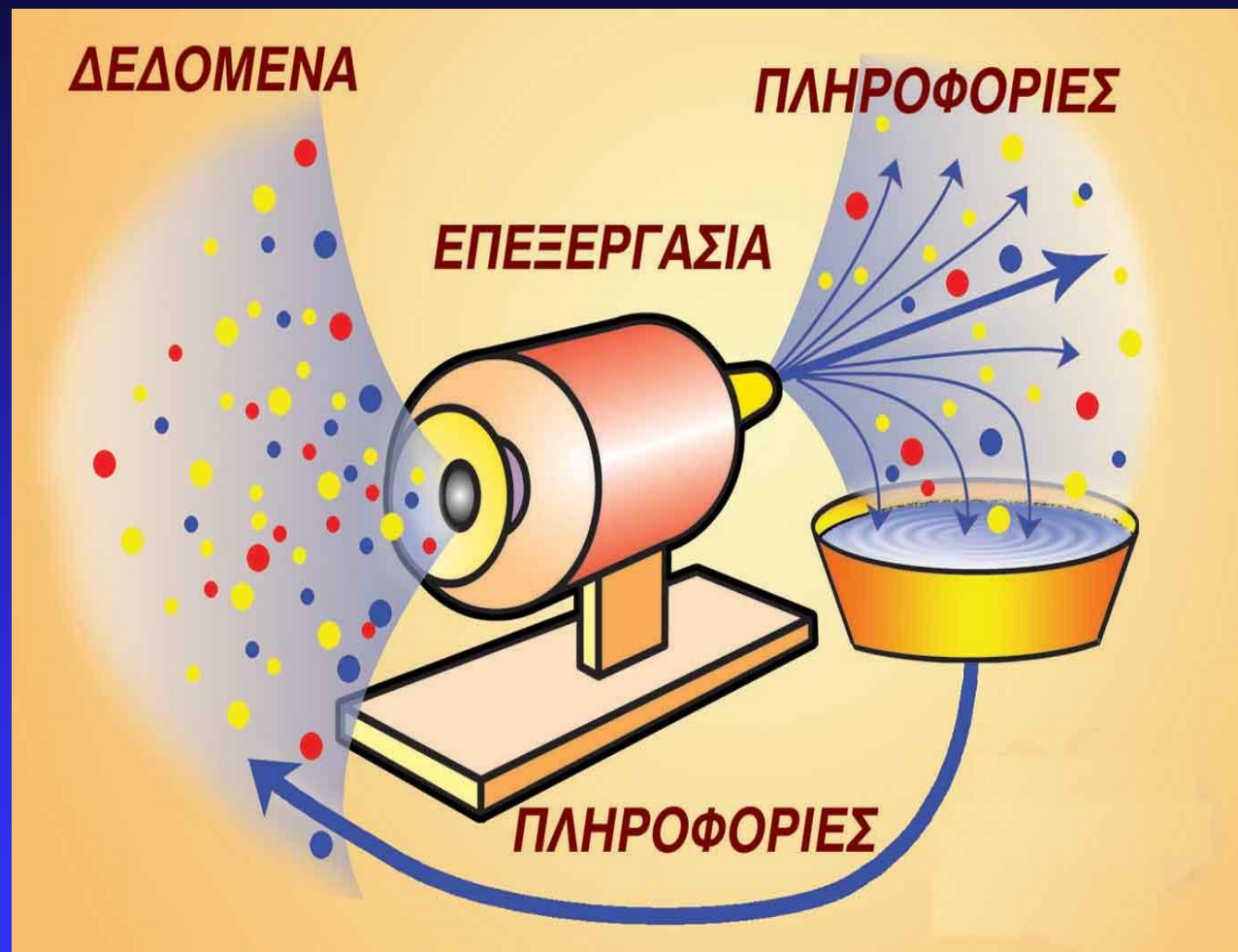
Εικόνα 1.1: Κύκλος Επεξεργασίας των Δεδομένων

Λέξεις Κλειδιά: Δεδομένα (Data), Πληροφορία (Information), Επεξεργασία (Processing), Υπολογιστής (Computer), Πληροφορική (Informatics )