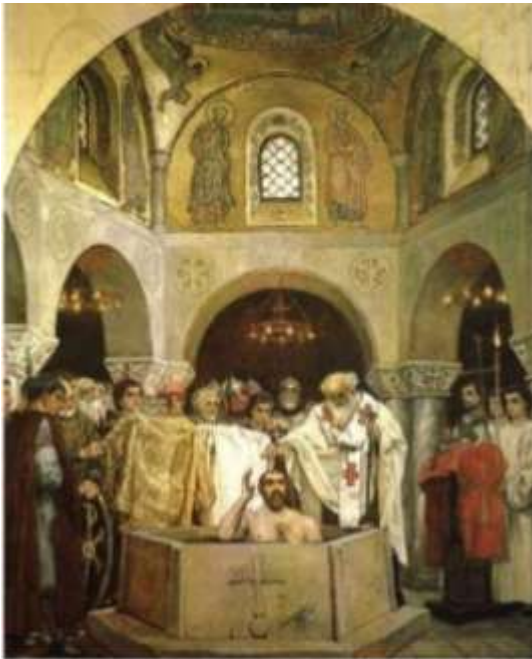
▲ Η βάπτιση του Βλαδίμηρου, πίνακας του Βίκτορ Βασνέτσοβ (1890).